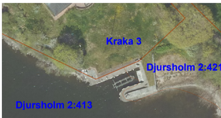
Figur 2: Hamnanläggningens placering

På kommunens fastigheter Djursholm 2:421 (landområde) och Djursholm 2:413 (vattenområde) finns en äldre hamnanläggning, som ligger i direkt anslutning till fastigheten Kraka 3. Fastighetsägaren till Kraka 3 har uttryckt ett intresse för att ta över hamnanläggningen.